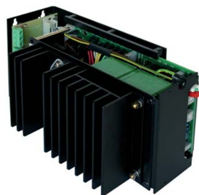
Abbildung mit Beispielgerät.

Aus technischen Gründen ist es nicht möglich, einen Wandmontagewinkel für alle Stromversorgungen zu verwenden. Für entsprechende Informationen nehmen Sie bitte Kontakt mit uns auf.